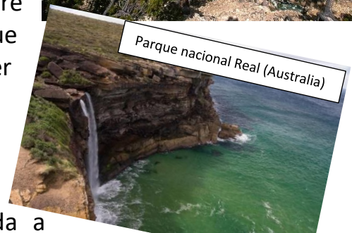
Parque nacional Real (Australia)